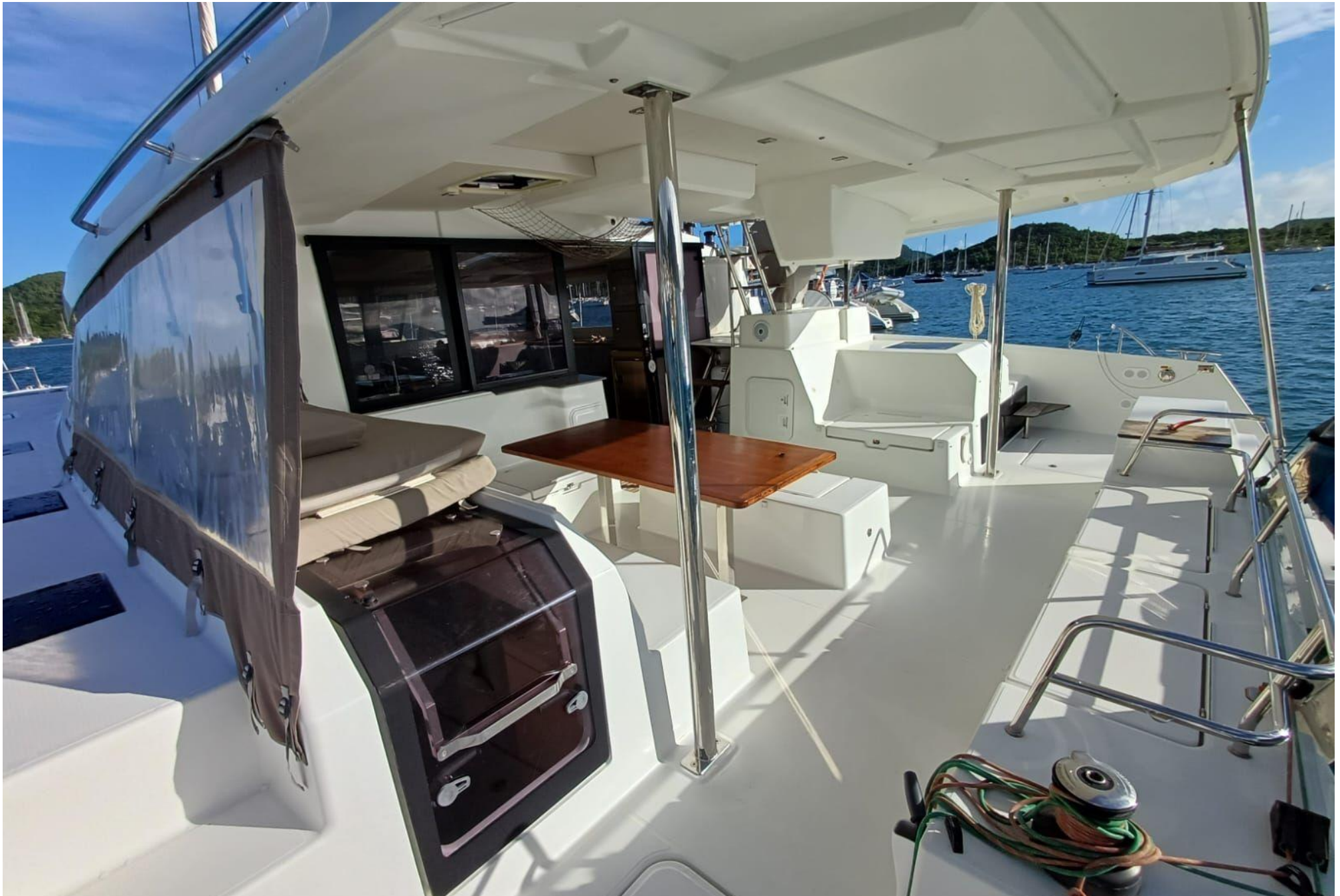
Fountainne Pajot SAONNA 47